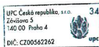
Jaroslav Růžička Oddělení dokumentace

Vyjádření vydala společnost UPC dne: 13.2.2017